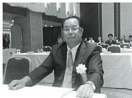
表彰される豊田副会長